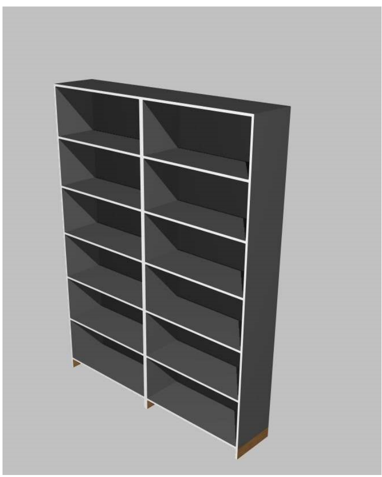
Προοπτική κατά μήκος τομή