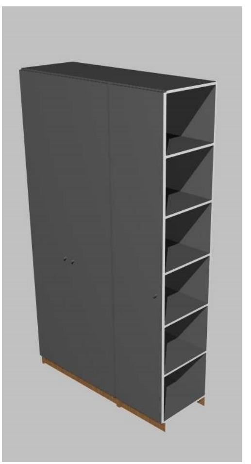
Προοπτική εγκάρσια τομή